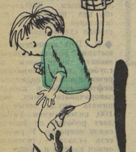
Рис. С. АНТОНОВА

Астраханская область, Красноярский район, пос. Степной.