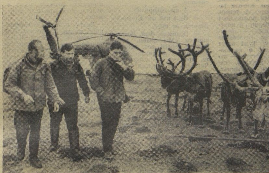
● «Ты солнцу и ветру брат», — поётся в песне о геологах. Люди этой несложной профессии исследуют недра земли в тундре, пустыне, непроходимой тайге... Вертолёт доставля геологов и на остров Байгаж, на берег Ледовитого океана.