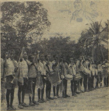
На пионерском линейке у них тоже звучит горн, раздаётся дробь барабана и прозвонится гитара — юные пионеры Кого всегда готовы бороться за правое дело, начатое их отцами. Сейчас в Народной Республике Кого пионерская организация объединяет молодёжьную армию школьников. НА СТИМЛЕ: юные пионеры Кого.

Ольга НИКИТИНО. Канжарская ССР, Джамбулская область, село Ново-Бозенное.